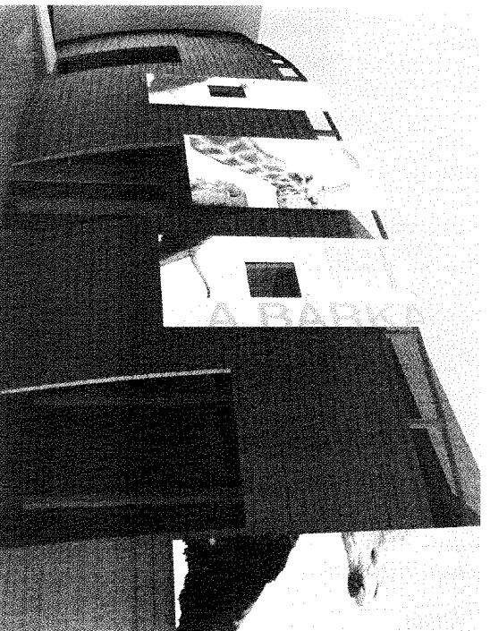
A megújuló bárka látványterve

A bárkába állatok serege igyekszik, ki kúszva, ki mászva, némelyek repülve. A bejárat kapufáján színpompás madár kapaszkodik és tekint a belépőre.