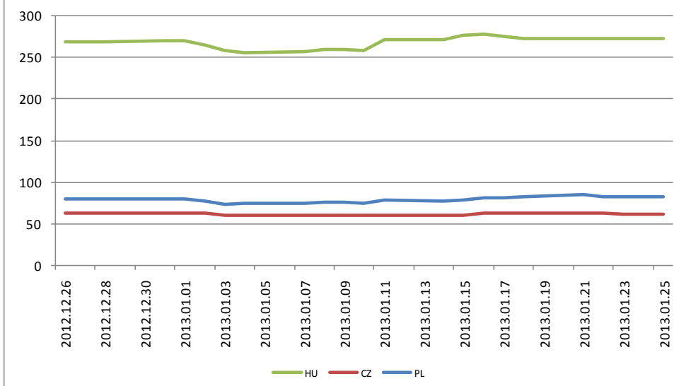
Régiós 5 éves CDS-ek alakulása az elmúlt 1 hónapban