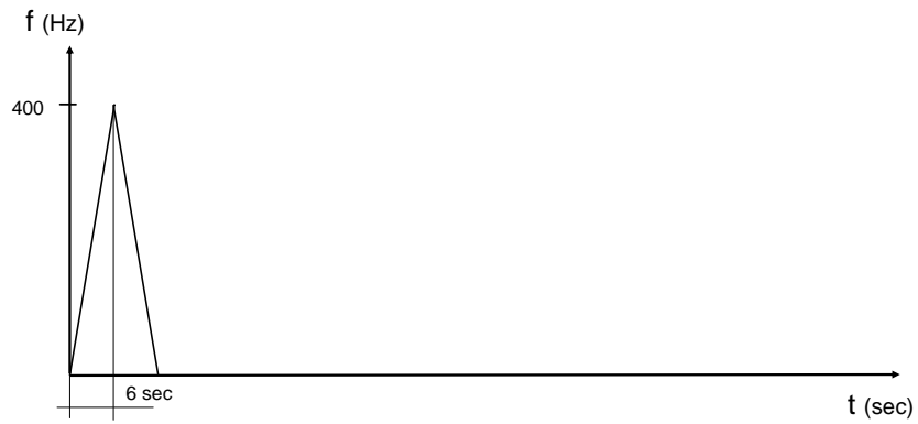
Morgató próba jelzés

A jelzés leírása: A próba során alkalmazott jelalak első részében 6 másodperces időtartamban 400 Hz-ig felfutó jelzés kerül leadásra, majd a jel lefutása következik be.