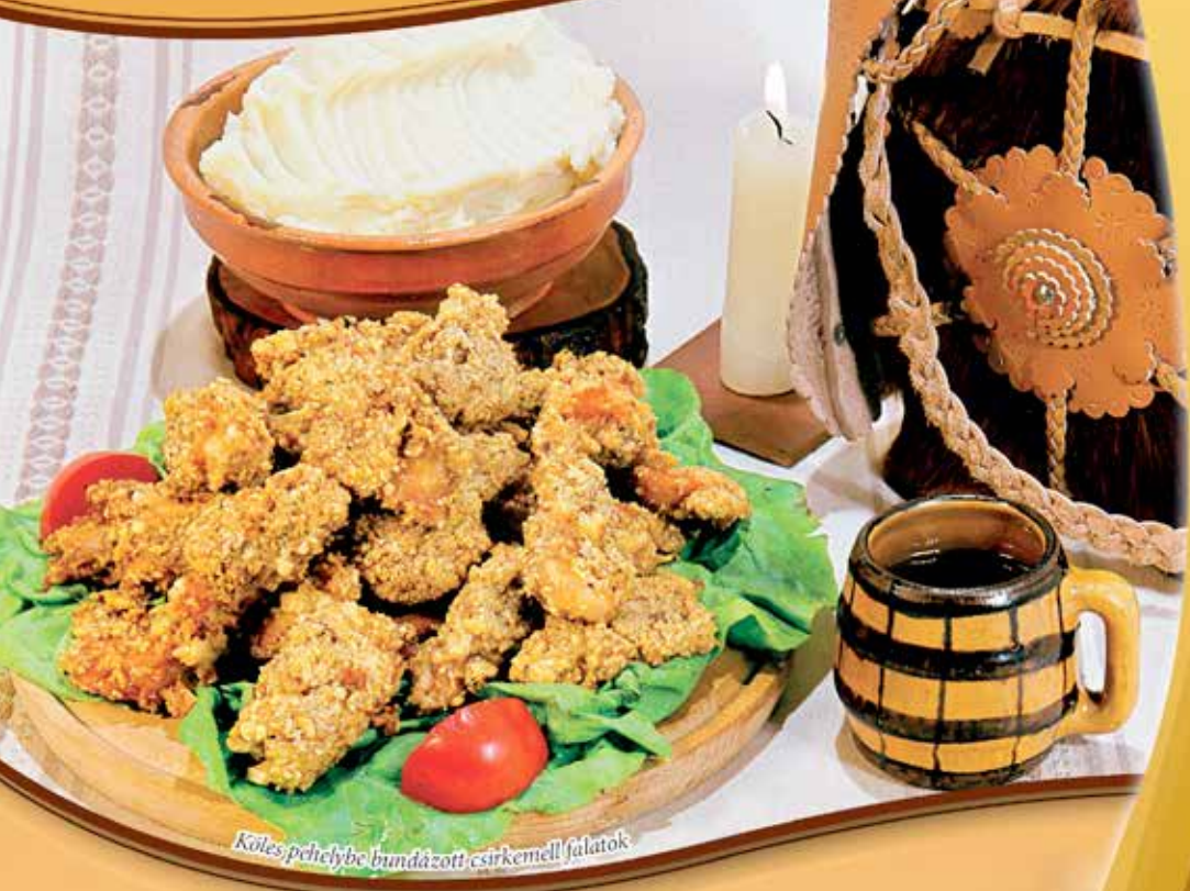
Köles pehelybe bundázott csirkemell falatok