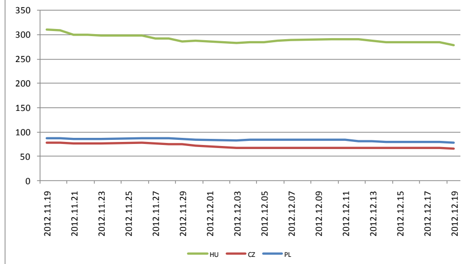
Régiós 5 éves CDS-ek alakulása az elmúlt 1 hónapban