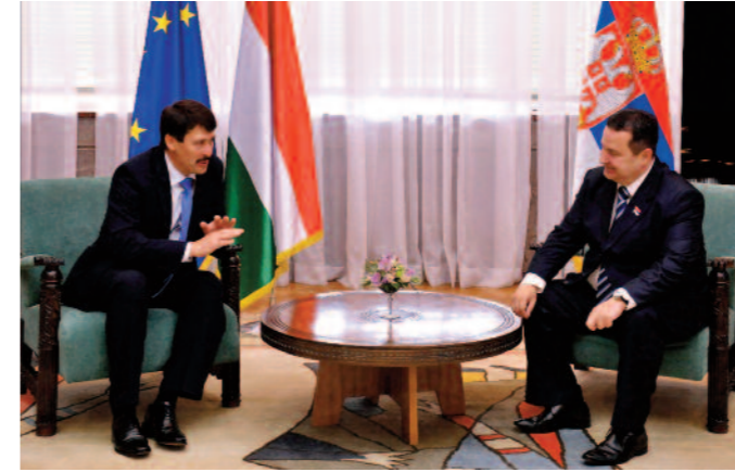
Ivica Dačić miniszterelnök és