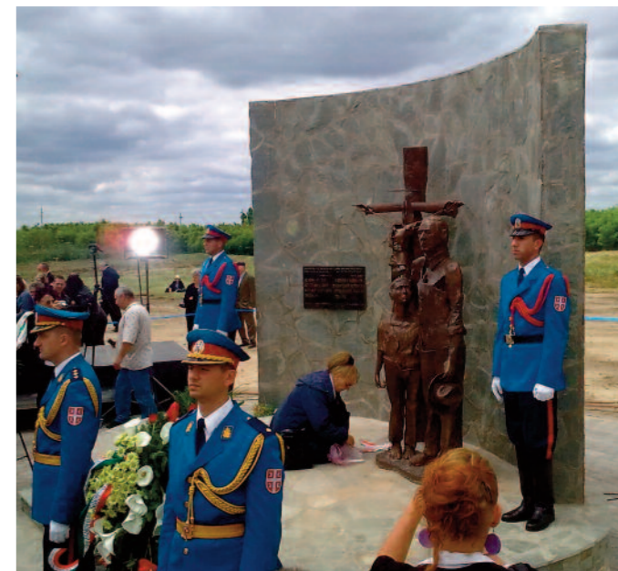
Az egykori sintérgödörök felett létesített emlékhely metamorfózisa arról tanúskodik, hogy a megbékélés iránti elkötelezettség valóságos, kézzelfogható eredményekre képes

sétány vezet hozzá. Reméljük, hogy a felszerelni tervezett kamerarendszer elejét fogja venni az esetleges rongálásoknak, és megfelelően garantálja majd az emlékmű biztonságát.