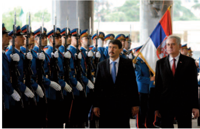
Áder Jánost fogadta Tomislav Nikolić köztársasági elnök,

Magyarország köztársasági elnökeként bocsánatot kért azokért a bűnökért, amelyeket a II. világháború során magyarok követtek el ártatlan szerbek ellen. A magyar köztársasági elnök beszédét felállva tapsolták meg a szerb parlament képviselői.