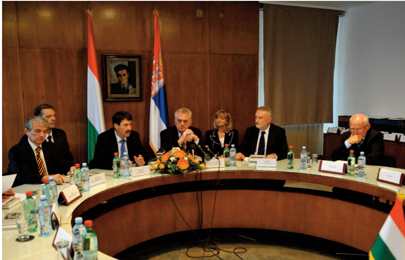
Áder János és Tomislav Nikolić a Magyar-Szerb Akadémiai Vegyes Bizottság kerekasztal-beszélgetésén

A vegyes bizottság eddigi munkája alapvető szerepet játszott abban, hogy létrejöhetett a két köztársasági elnök 2013-as történelmi főhajtása.