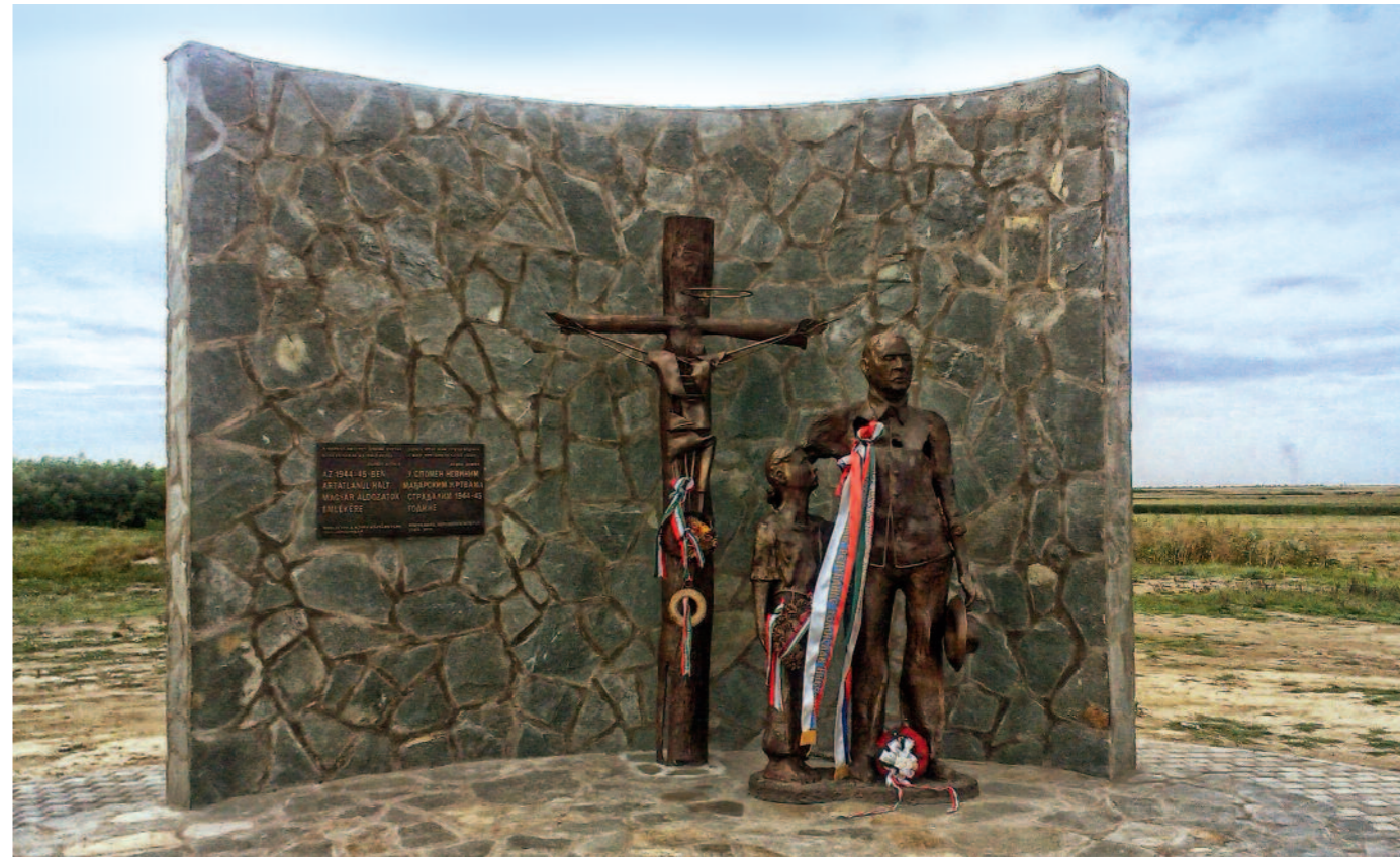
Szimbolikus jelentőségű, hogy a szerb áldozatok csúrogi emlékhelyének felújítására magyar hozzájárulásból került sor, míg a magyar áldozatok emlékművének felállítását Szerbia finanszírozta

Hetven évet kellett várnunk arra, hogy egymás szemébe nézve közösen is kimondhassuk: a bűnnek nincs származása, sem nemzetisége. Nincsenek bűnös népek. Csak bűnös tettek, bűnös indulatok, bűnös emberek vannak.