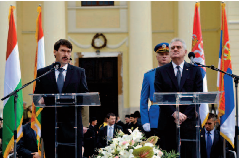
Áder János és Tomislav Nikolić a csúrogi ortodox templom előtt