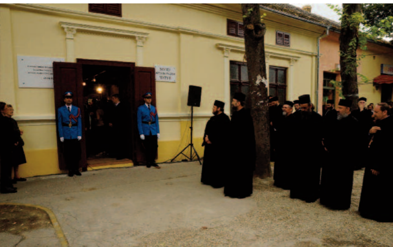
A felújított Topalov raktár előtt

Csúrog a Tisza jobb partján, a Sajkás-vidék északi részén fekszik. A magyar razzia szerb áldozatainak száma itt volt a legmagasabb: szerb adatok szerint 887 fő, közöttük több gyermek, idős ember és nő. A település központjában lévő Topalov raktárban