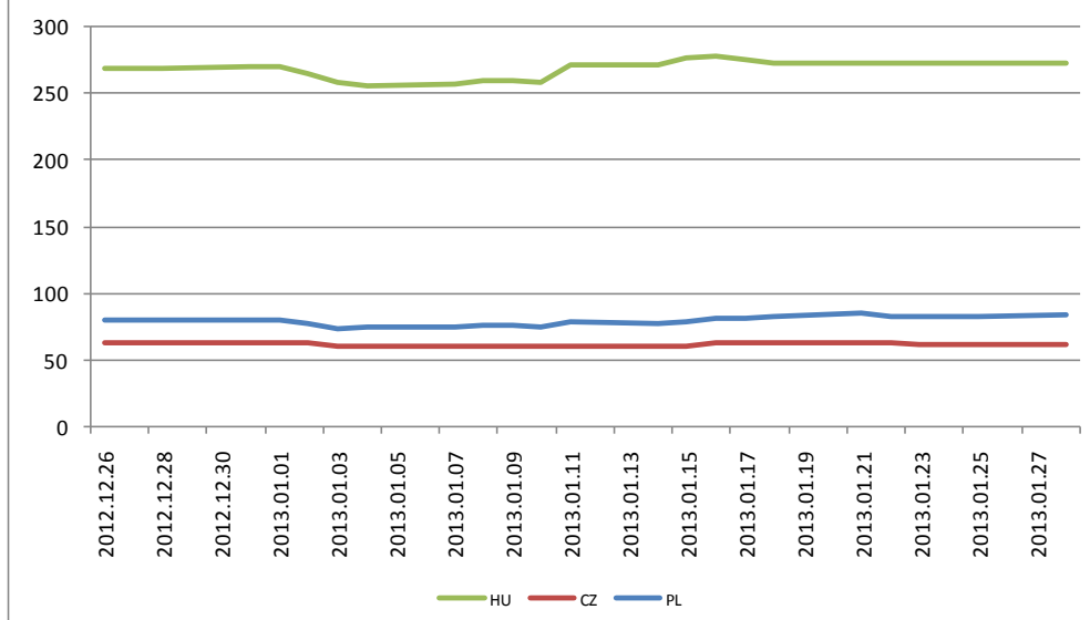
Régiós 5 éves CDS-ek alakulása az elmúlt 1 hónapban